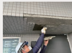
再発を防ぐための改良圧着張り工法

建装工業株式会社(神奈川県支部) 東京フロンティアシティパーク&パークス第1回大規模修繕工事