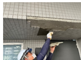
再発を防ぐための改良圧着張り工法

建装工業株式会社横浜支店(神奈川県支部) 東京フロンティアシティパーク&パーク第1回大規模修繕工事